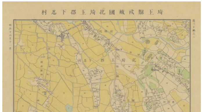
迅速測図原図の埼玉古墳群