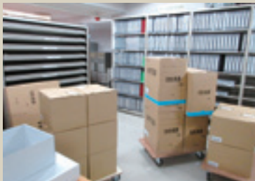
地図保存庫での資料搬出の様子