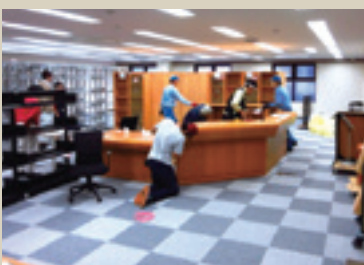
暫定開館中の閲覧室営の様子 (文書館北隣K・Sビル2階)