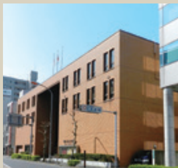
写真1 文書館正面外観 右隣の白い建物が暫定開館中の仮事務所が置かれているK・Sビル