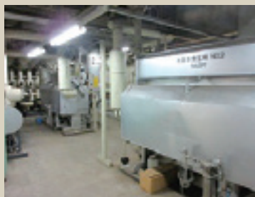
写真2 地下2階 機械室