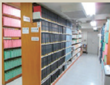
写真3 保存庫8の固定書架