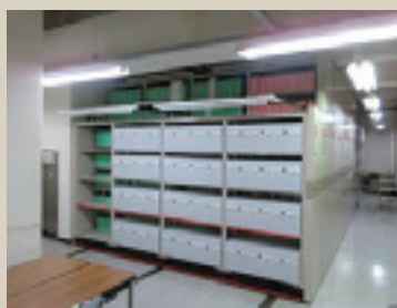
写真4 保存庫7の集密書架